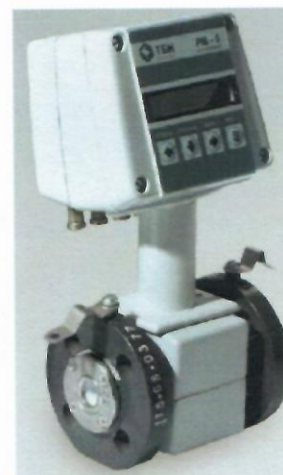
в) Счетчики-расходомеры электромагнитные РМ-5