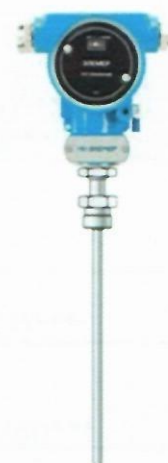
е) Термопреобразователи с унифицированным выходным сигналом ТПУ 0304