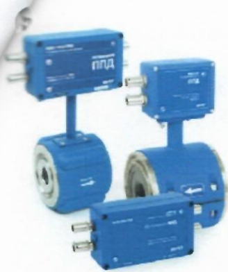
а) Расходомеры-счетчики ультразвуковые «ВЗЛЕТ МР»