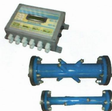
ж) Расходомеры-счетчики жидкости ультразвуковые многолучевые ЭТАЛОН-РМ