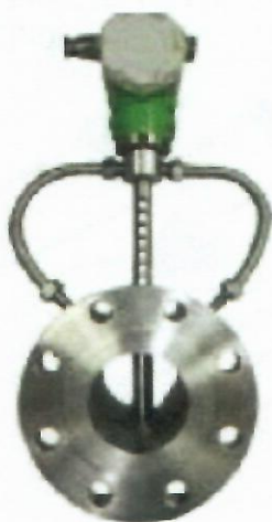
г) Преобразователи расхода вихревые «ЭМИС-ВИХРЬ 200(ЭВ 200)»