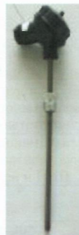
в) Термометры сопротивления из платины технические ТПТ-1, ТПТ-17, ТПТ-19, ТПТ-21, ТПТ-25Р