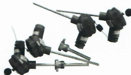
д) Комплекты термопреобразователей сопротивления платиновых КТС-Б