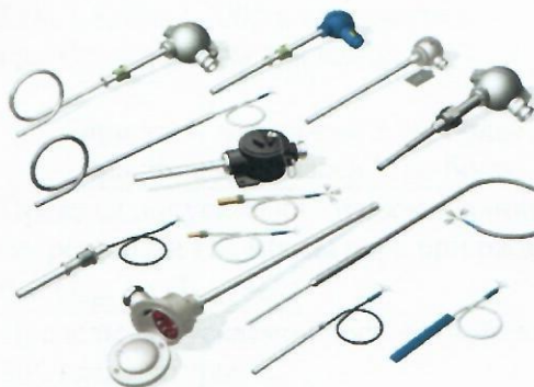
г) Термометры сопротивления платиновые ТСПТ, медные ТСМТ