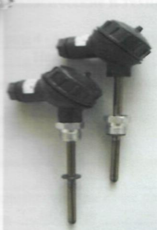
а) Комплекты термометров сопротивления из платины технически разностных КТПТР-01, КТПТР-03, КТПТР-06, КТПТР-07, КТПТР-08