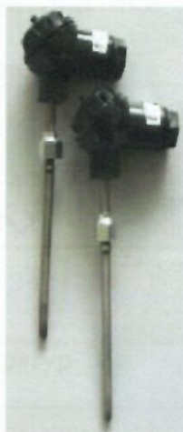
б) Комплекты термометров сопротивления из платины технически разностных КТПТР-04, КТПТР-05, КТПТР-05/1