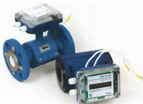
б) Расходомеры счетчики электромагнитные «ВЗЛЕТ ЭР» модификация «Лайт М»