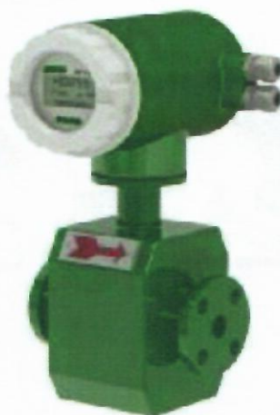
д) Расходомеры электромагнитные ЭМИС-МАГ 270